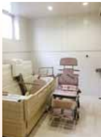
体に負担がかかりにくい浴室