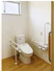
広々としたお手洗い